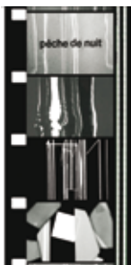
Pêche de Nuit (1963). Fotogram van Jean Mil

The Making of Environnement I (slideshow Jean Mil, 1967/2007)