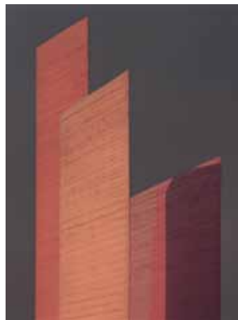
Torres de la Ciudad Satélite (Towers of Satellite City), Mexico City, 1957.