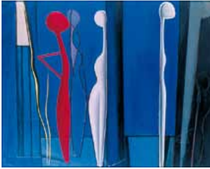
Luc Peire. La Figure rouge (1954, olieverf op doek, 81 x 100 cm, CR 599)

werd hij eensklaps de belangrijkste experimentele romanschrijver van Vlaanderen. En dat was wellicht ondenkbaar geweest zonder de invloed van de moderne schilderkunst, van onder anderen Luc Peire, met wie hij zich zeker sterk verwant voelde op basis van een quasi parallelle geleidelijke zoektocht naar experiment en vernieuwing. 6