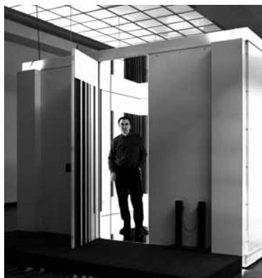
1967. Paris. Luc Peire, Environnement I (1967)

Du dimanche 8 juillet au dimanche 16 septembre 2007, l' Environnement I (ILP 777, 1967, Collection Communauté flamande) de Luc Peire sera exposé à la Fondation. Ce « cube-miroir aux parois intérieures en graphies en noir et blanc » est prêté temporairement à la Fondation par le S.M.A.K. de Gand.