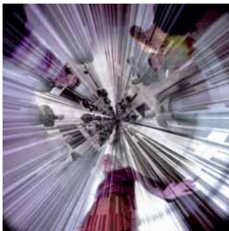
Luc Peire's Environment (1969), 'Vertige'